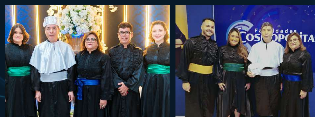
DIREÇÃO GERAL E ACADÊMICA E COORDENAÇÃO DOS CURSOS FORMADOS